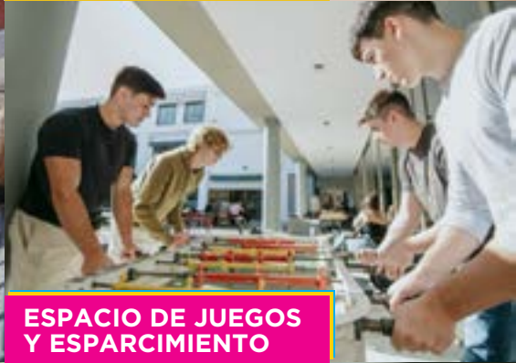
ESPACIO DE JUEGOS Y ESPARCIMIENTO