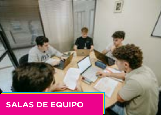
SALAS DE EQUIPO