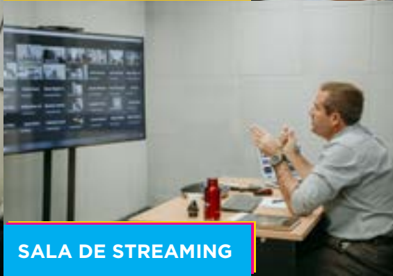
SALA DE STREAMING